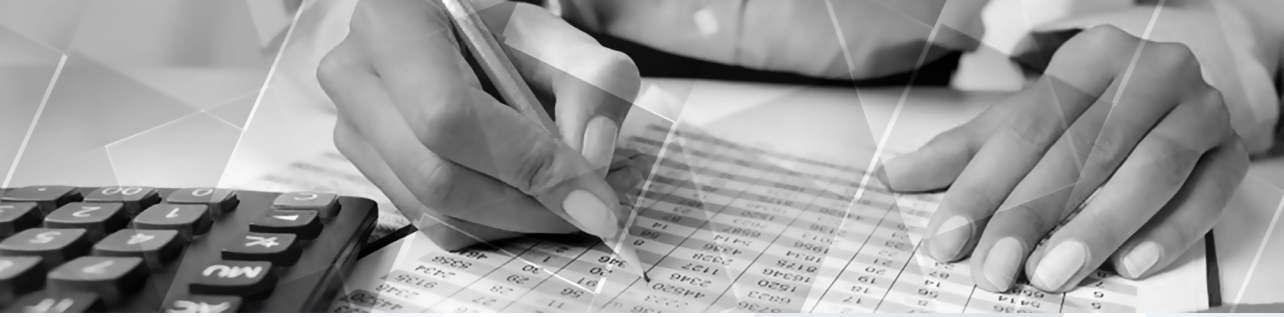
TABLA DE EQUIVALENCIA DE TÉRMINOS

Las funciones principales de la revisoría fiscal y el contenido de su informe están incorporadas en el Código de Comercio, redactadas con una terminología que no es armónica con las que utiliza el nuevo marco normativo de auditoría y aseguramiento. Por lo tanto, para ser fiel a este marco, en el texto de este libro se utilizan los términos de las Normas Internacionales de Auditoría (NIA). Para una mejor comprensión del libro, se incluye la siguiente tabla de equivalencia: